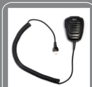
Наручный микрофон SM07R2