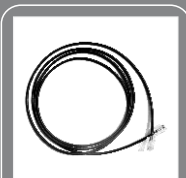
Кабель для клонирования CP06