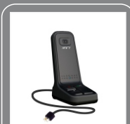
Настольный микрофон SM10R2