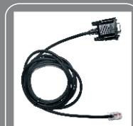
Кабель для программирования PC21