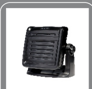
Внешний динамик SM09S2