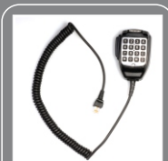
Микрофон с клавиатурой SM07R1